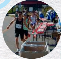
スタート地点 水、スポーツドリンク