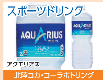
スポーツドリンク アクエリアス 北陸コカ・コーラボトリング