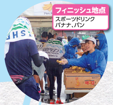
フィニッシュ地点 スポーツドリンク バナナ、パン