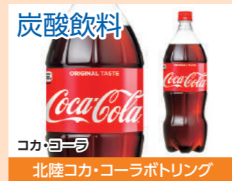
炭酸飲料 コカ・コーラ 北陸コカ・コーラボトリング