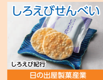
しろえびせんべい しろえび紀行 日の出屋製菓産業