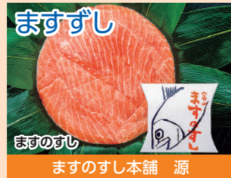
ますずし ますのすし本舗 源