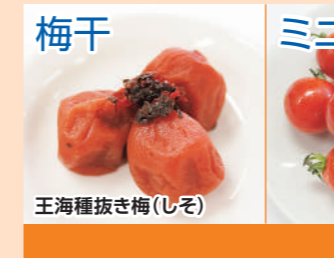
梅干 王海種抜き梅(しそ) アルピス