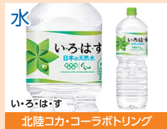
水 いろはす 北陸コカ・コーラボトリング