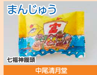
まんじゅう 七福神饅頭 中尾清月堂