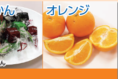
ようかん 一回ようかん