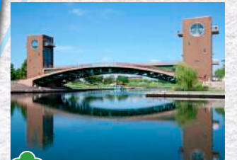
6 富岩運河環水公園