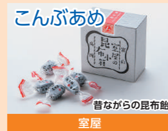
こんぶあめ 昔ながらの昆布飴 室屋