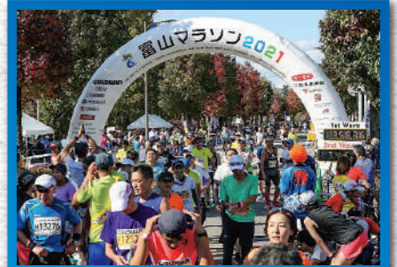
マラソンフィニッシュ