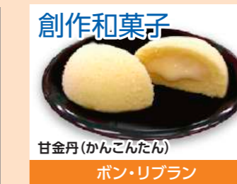
創作和菓子 甘金丹(かんこんたん) ボン・リブラン