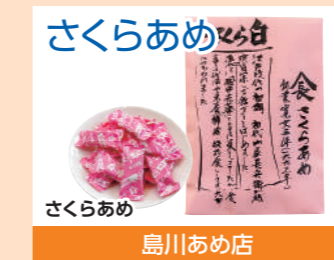
さくらあめ さくらあめ 島川あめ店