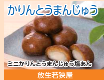
かりんとうまんじゅう ミニかりんとうまんじゅう塩あん 放生若狭屋