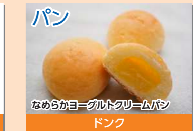
パン なめらかヨーグルトクリームパン ドンク