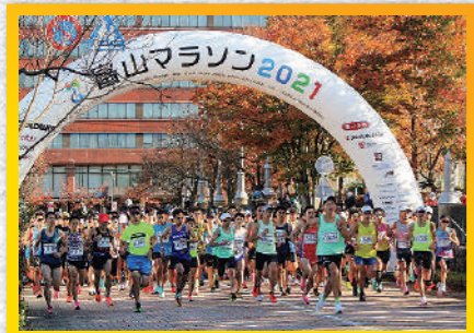
マラソンスタート

ただ走るだけじゃもったいないのが富山マラソン！ コース沿線の風景やおいしい富山を味わってください