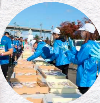
22.7 km 地点 第6給水所 富山新港港湾労働者福祉センター前 サブコース 本コースと同じ