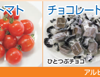
ミニトマト ひとつぶチョコ