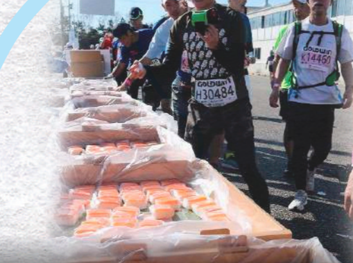
11.6 km 地点 第3給水所 庄川沿い(国道8号越えてすぐ) 水、スポーツドリンク、ようかん こんぶあめ、チョコレート