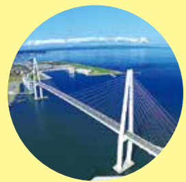
日本海側最大級の斜張橋である新湊大橋。自動車専用道路であるため、富山マラソンでしか走れません。コース最大の難所ですが、頂上から見るパノラマは絶景!!