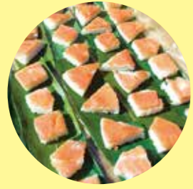
すっきりお馴染みとなった「ますずし」。他にも白えび天むすをはじめ、富山ならではの食をエイドにて提供します。