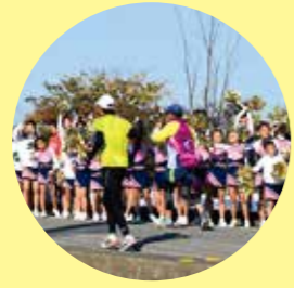
小さい子供からお年寄りまで世代を越えた途切れない応援が富山マラソンの大きな魅力。