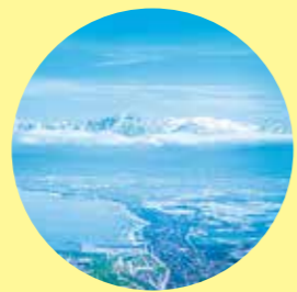
道中至る所から望める立山連峰。山・海・まち、富山でしか見ることのできない風景を堪能してください。

立山連峰や「世界で最も美しい湾クラブ」に加盟が認められた富山湾など豊かで美しい自然と、多彩な歴史や文化が息づく「まち」の魅力を体感できるコースです。絶景を誇る新湊大橋はこの大会でしか走れません。エイドでは「ますずし」など富山らしい給食でもてなします。走って富山を旅しよう!