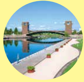
フィニッシュ地点となる「富岩運河環水公園」。広く開放的な景色はゴールしたランナーに心地よいひとときを提供します。