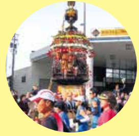
高岡御車山をはじめ、コース沿道の伝統芸能が繰り出で応援。全国でも珍しい馬による応援もあるかも・・・