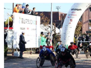
車いすレーススタート