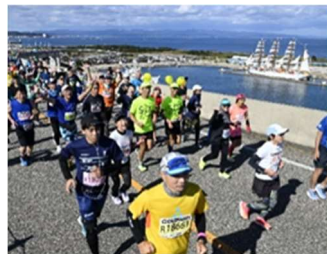
新湊大橋上のランナー