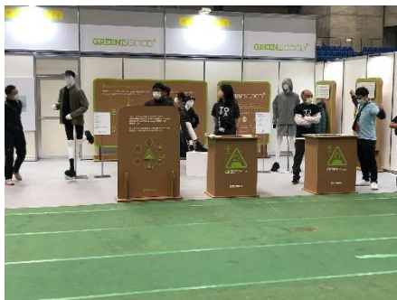
不要衣類回収の様子