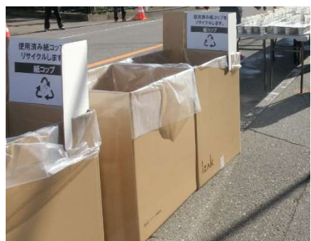
紙製コップ専用ゴミ箱