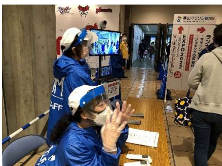
入場時の検温の実施