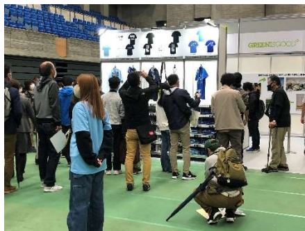
リサイクル素材を使用したTシャツ