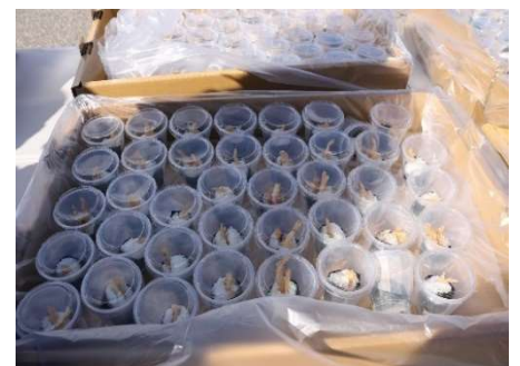
個包装の給食(白えび天むす)