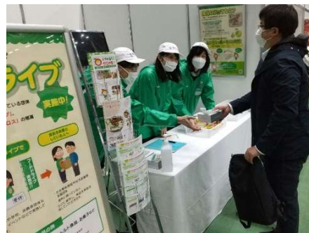
フードドライブブース