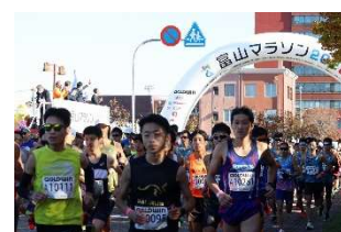
マラソンスタート